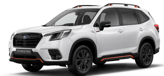
Crystal White Pearl