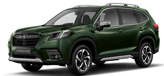
Cascade Green Silica